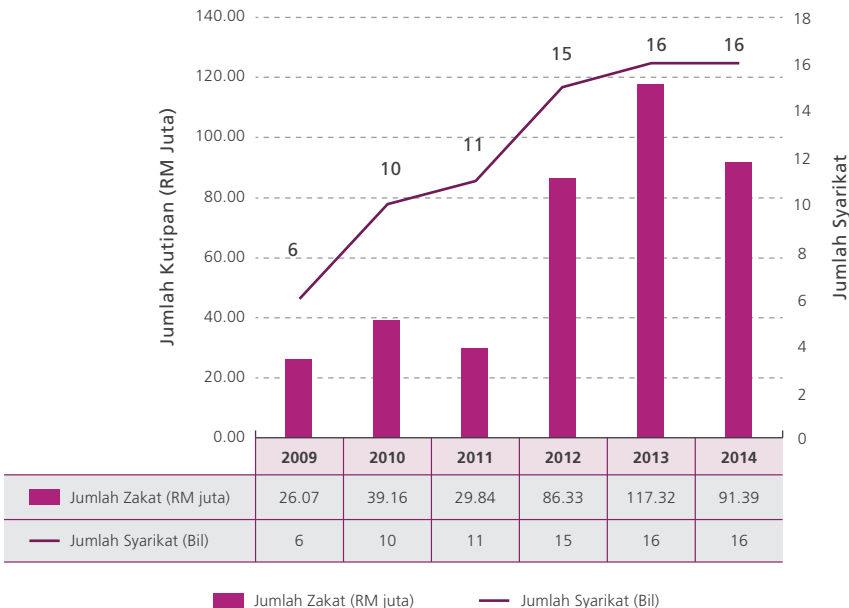
Tren Pembayaran Zakat PLC 2009-2014